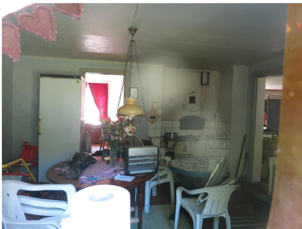
Köket i Vackratorp 2015