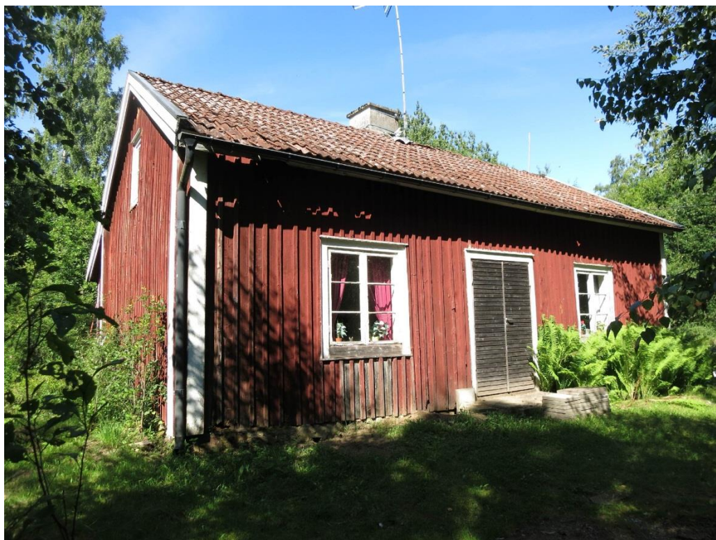
Vackratorp 2015