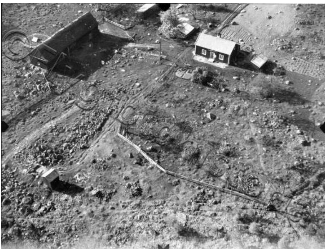
Flygfoton över Vackratorp från 1950-talet. Ladugården uppeldad 1966.