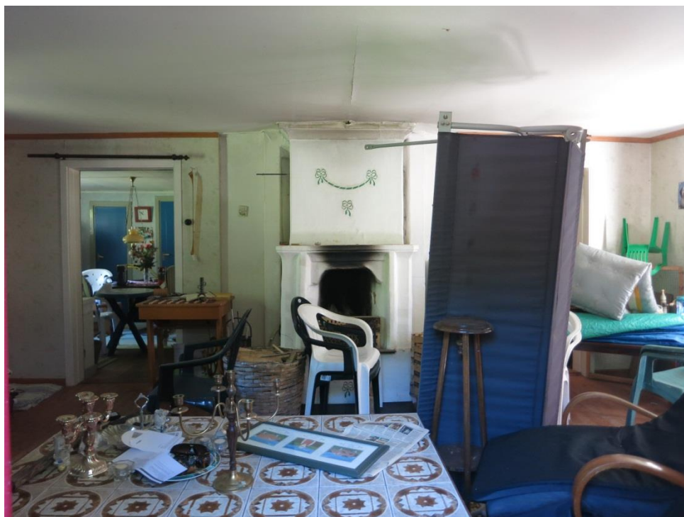
Vardagsrummet i Vackratorp 2015