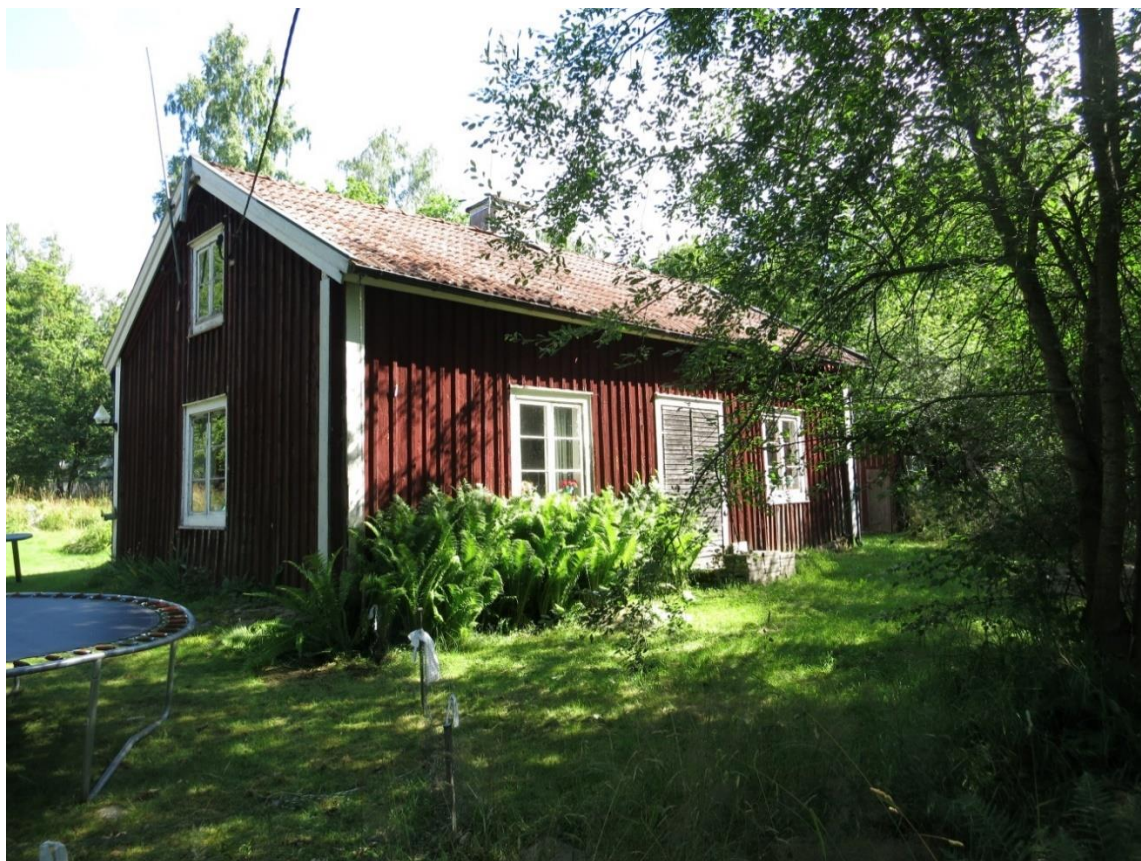
Vackratorp 2015, stället helt igenväxt.