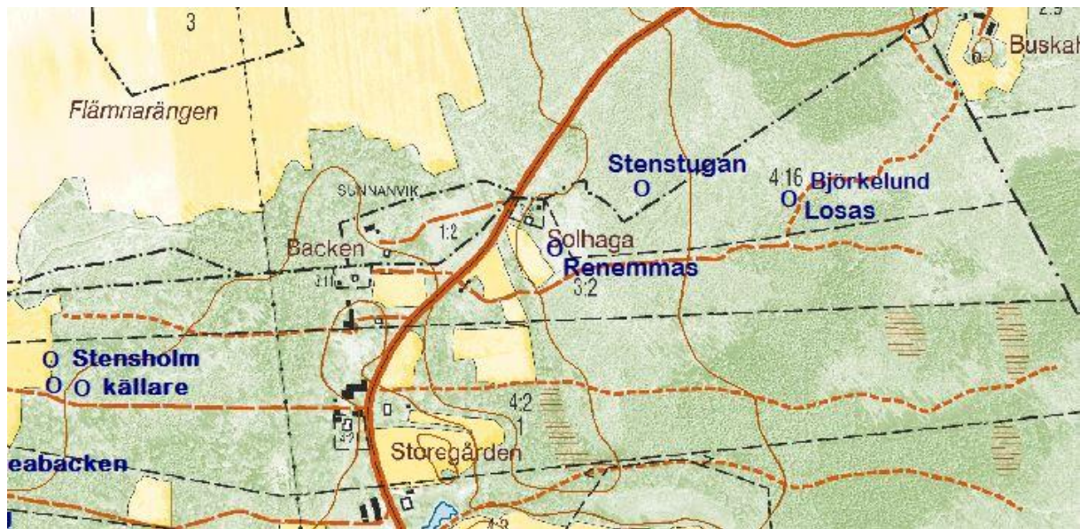
Utdrag från fastighetskartan © Lantmäteriet 452076

Läge koordinater (RT90 2,5 gon W 0:-15) :