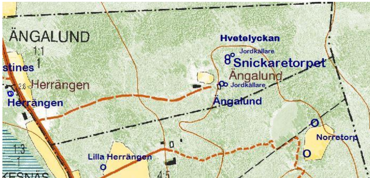
Utdrag från fastighetskartan © Lantmäteriet 452076

X=6286013 Y= 142946 N=56 41 45, 33 E=14 39 13, 69