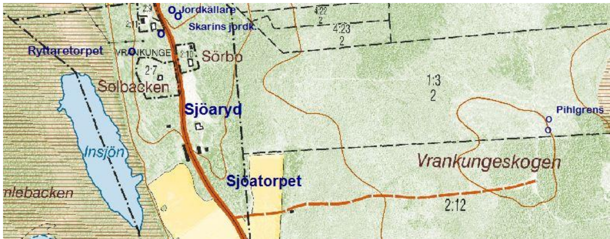
Utdrag från fastighetskartan © Lantmäteriet 452076