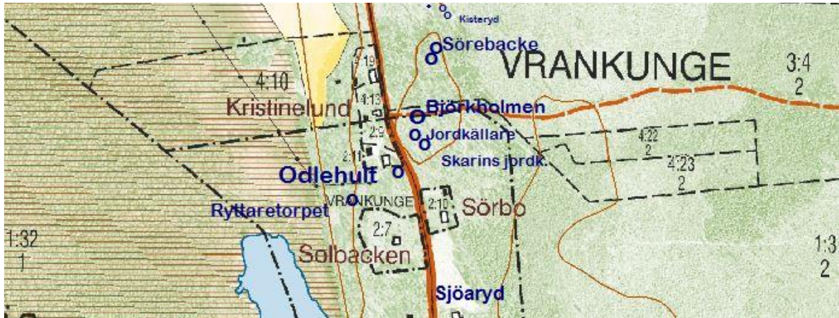
Utdrag från fastighetskartan © Lantmäteriet 452076

Läge koordinater (RT90 2, 5 gon W 0:-15): X=6286728 Y= 1428578 Latitud longitud (SWEREF 99 WGS84): N=56 42 07, 91 E=14 38 21, 37