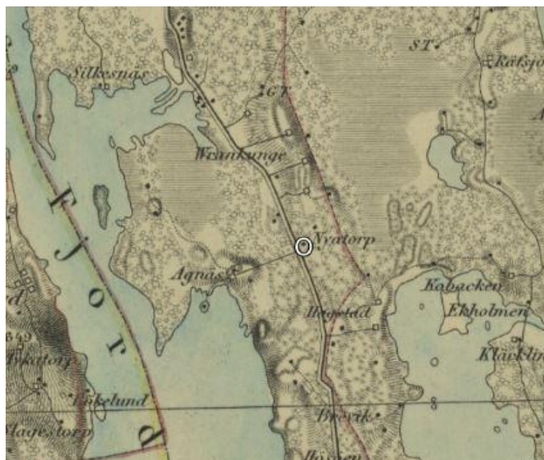
Utdrag från generalstabskartan 1869

Torpet etablerades före 1770 som boställe för en skogvaktare av häradsskogen (därav det ursprungliga namnet Wachttorpet) och revs ca 1930. Husgrunder återfinns idag mitt emot avfartsvägen till Agnäs. Efter privatiseringen av häradssallmanningen år 1840 kom torpet att ägas av grevarna Hamilton på Huseby, under Hössö Norregård.