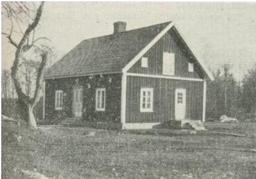
Bokelund, tidigare kallat Norvik, foto från 1940