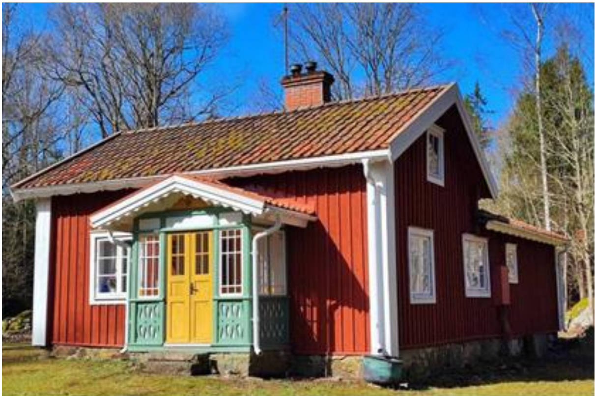
Hagstad Norratorp efter tillbyggnad (bild från 2024)