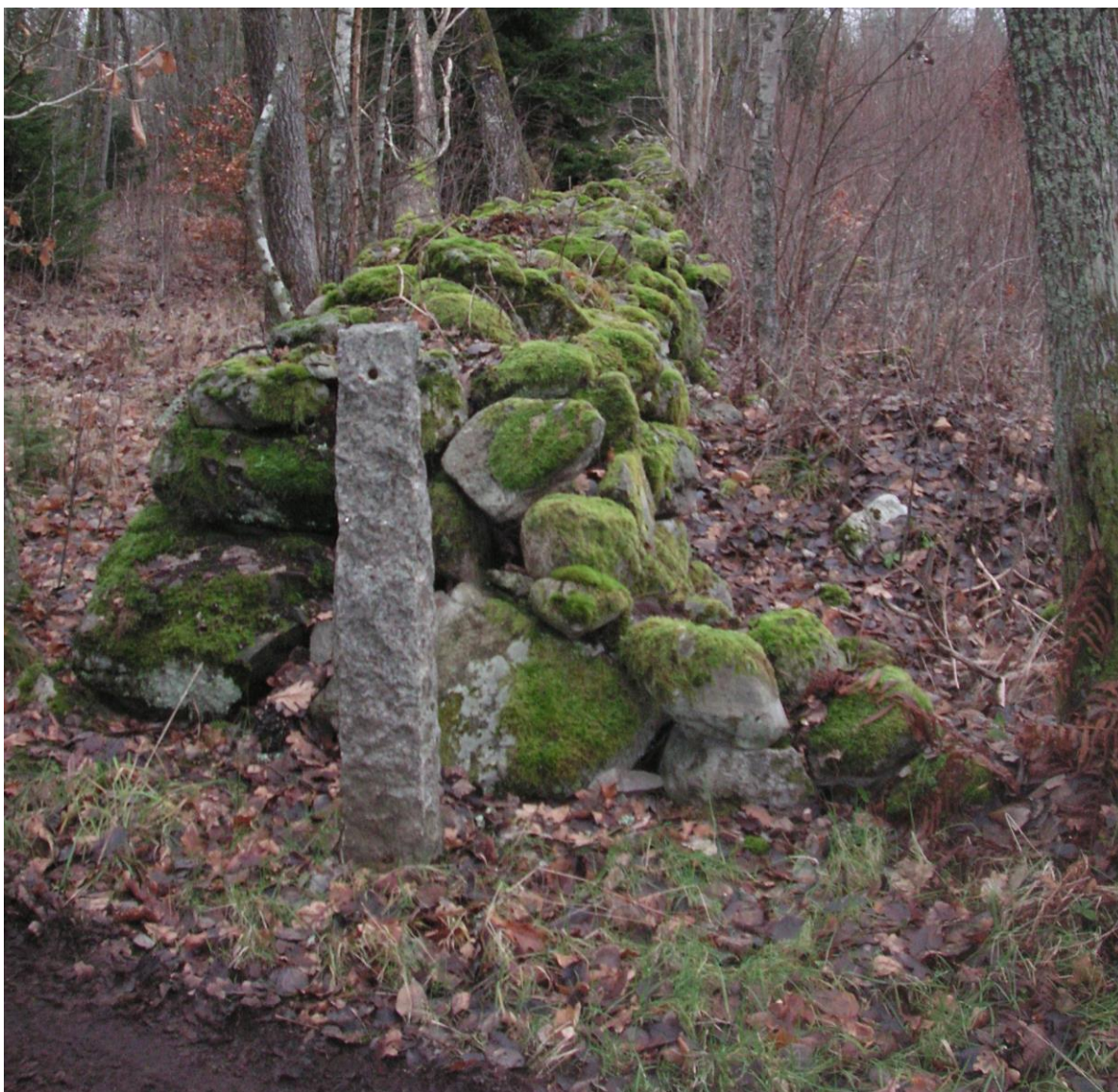
Stengårdsgård utmed tillfartsvägen till Norratorp, med stenstolpe vid gränsen mellan Norratorp och Granelund.