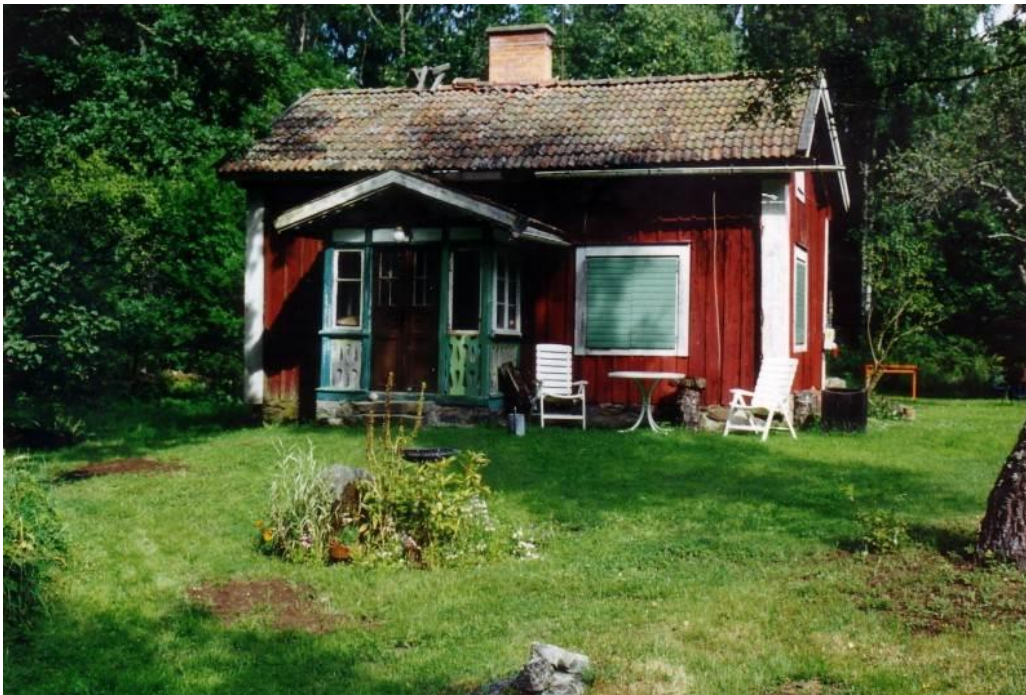
Norratorp (Branen/Branakallens/Norräng) under Hagstad Norregård, uppfört på 1860-talet.