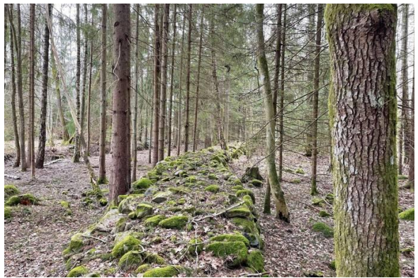
Bilder tagna i samband med försäljningen av Norratorp år 2024