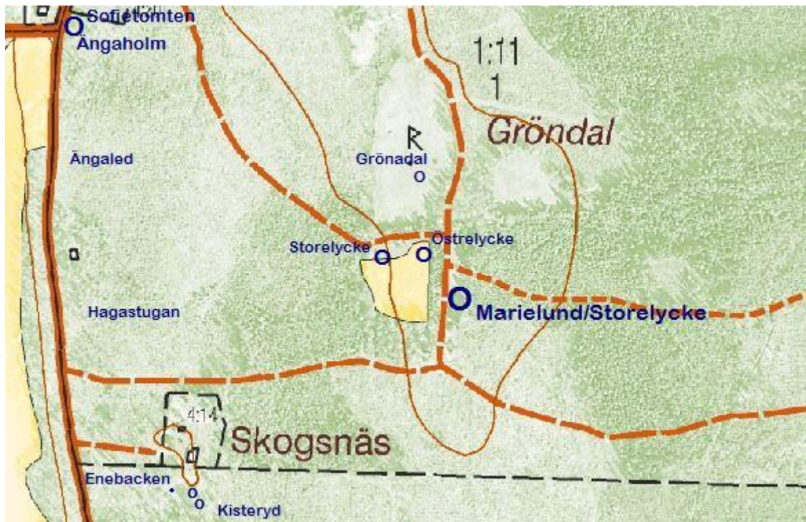
Utdrag från fastighetskartan © Lantmäteriet 452076