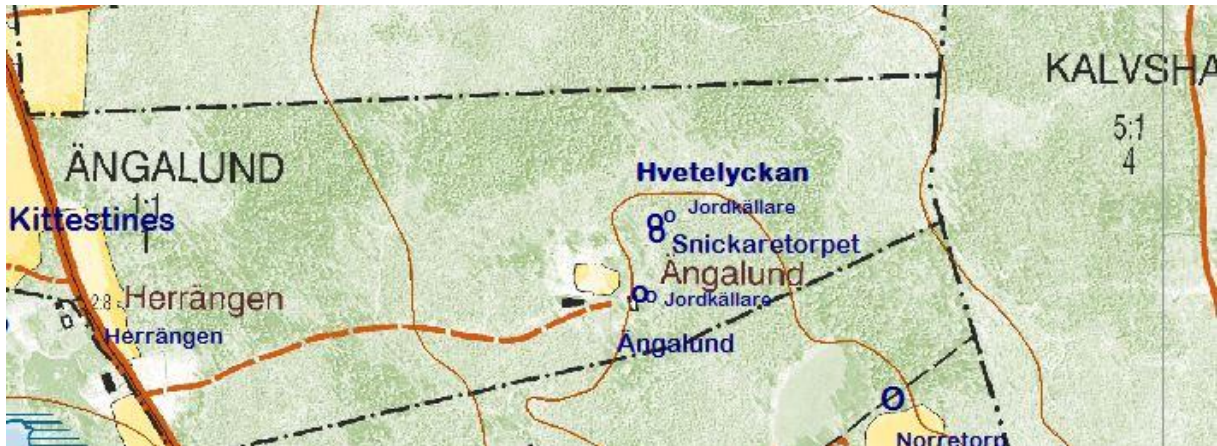
Utdrag från fastighetskartan © Lantmäteriet 452076

Läge koordinater (RT90 2, 5 gon W 0: -15): X= 6286040 Y= 1429500 Latitud longitud (SWEREF 99 WGS84): N= 56 41 46 E= 14 39 16