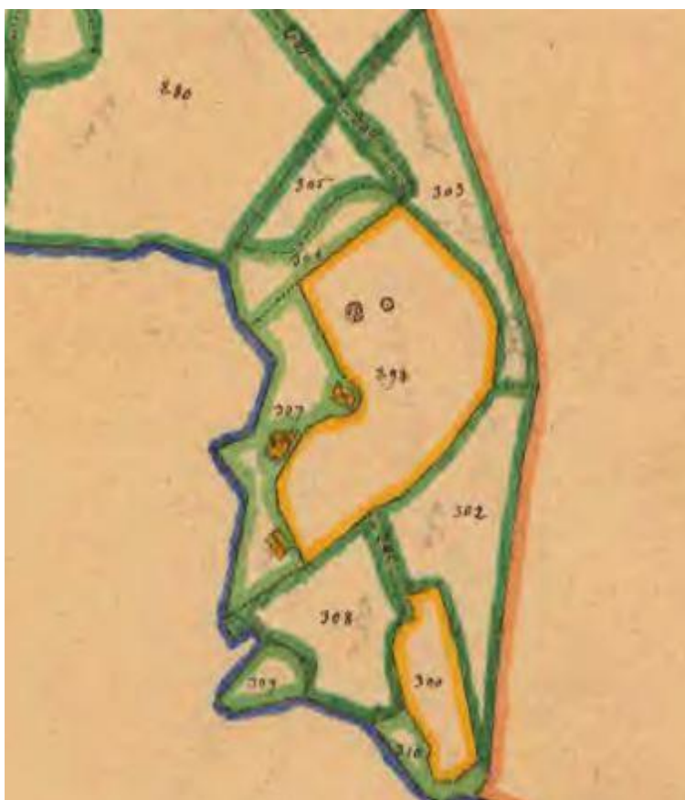
Utdrag från karta över Silkesnäs 1884 Lantmäteriet