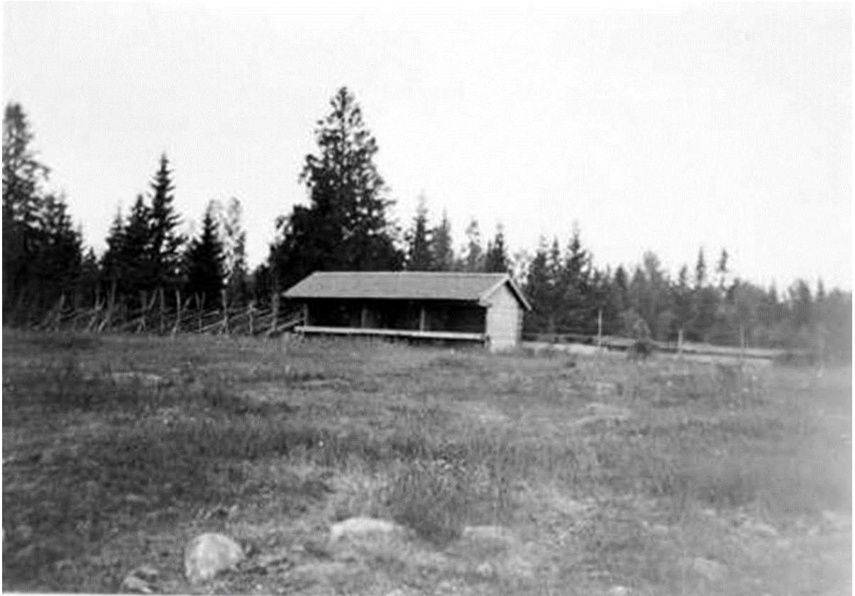
Marknadsbod på Hultamarken år 1935.

Marknadsplatsen ”Hultamarken” låg där två vägar möttes, vägen mellan Vederslöv och Vrankunge samt vägen mellan Kalvsvik och Huseby, på allmanningen för Skäggalösa by. Bönderna i byn fick 1836 tillstånd av Kommerskollegium att bedriva kreatursmarknad i Vaghult. De uppförde och ägde marknadsständer, varav något finns kvar än idag.