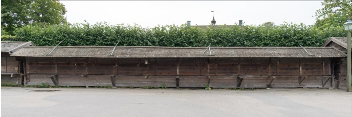
Marknadsbod från Hultamarken på Skansen i Stockholm.

År 1930 såldes 3-4 av marknadsbodarna och flyttades till Skansen i Stockholm, där de finns uppsatta vid Bollnästorget.