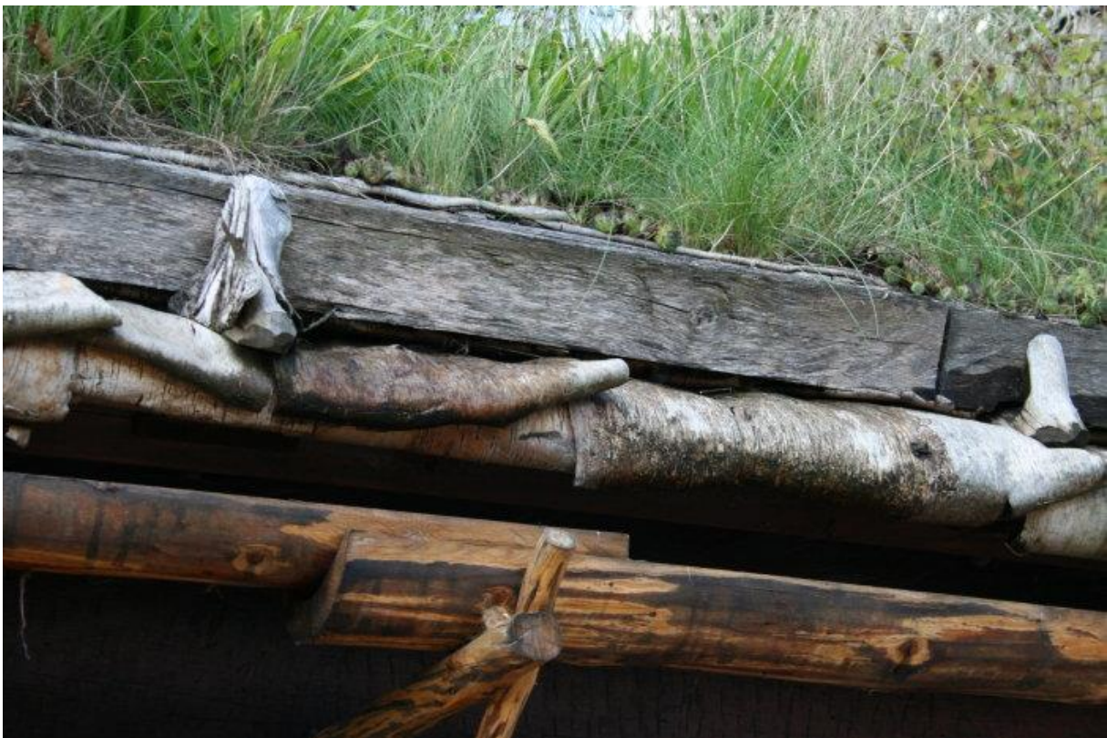
Takfot med näver och torv.