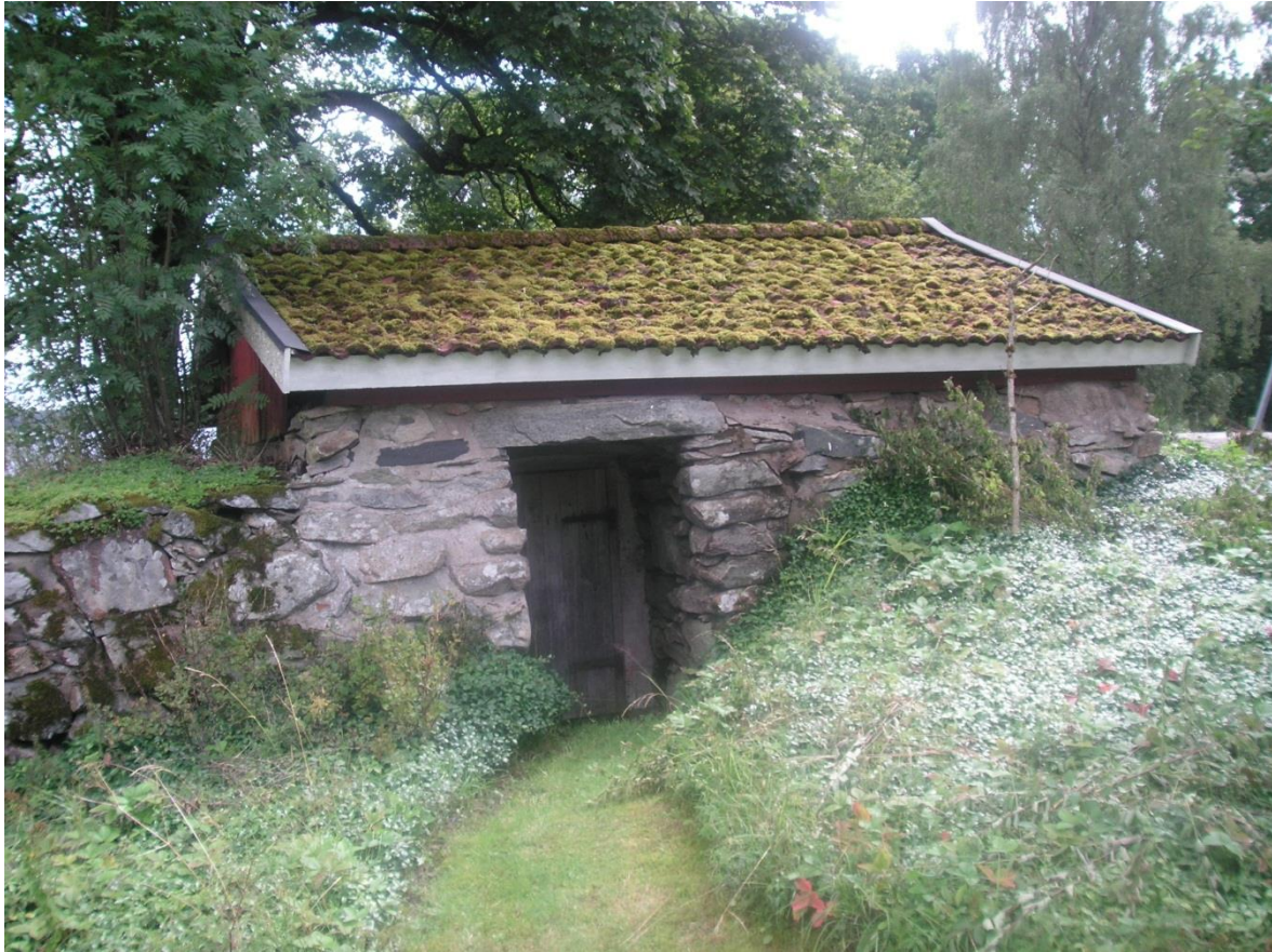
Stenkällaren i Hallen.