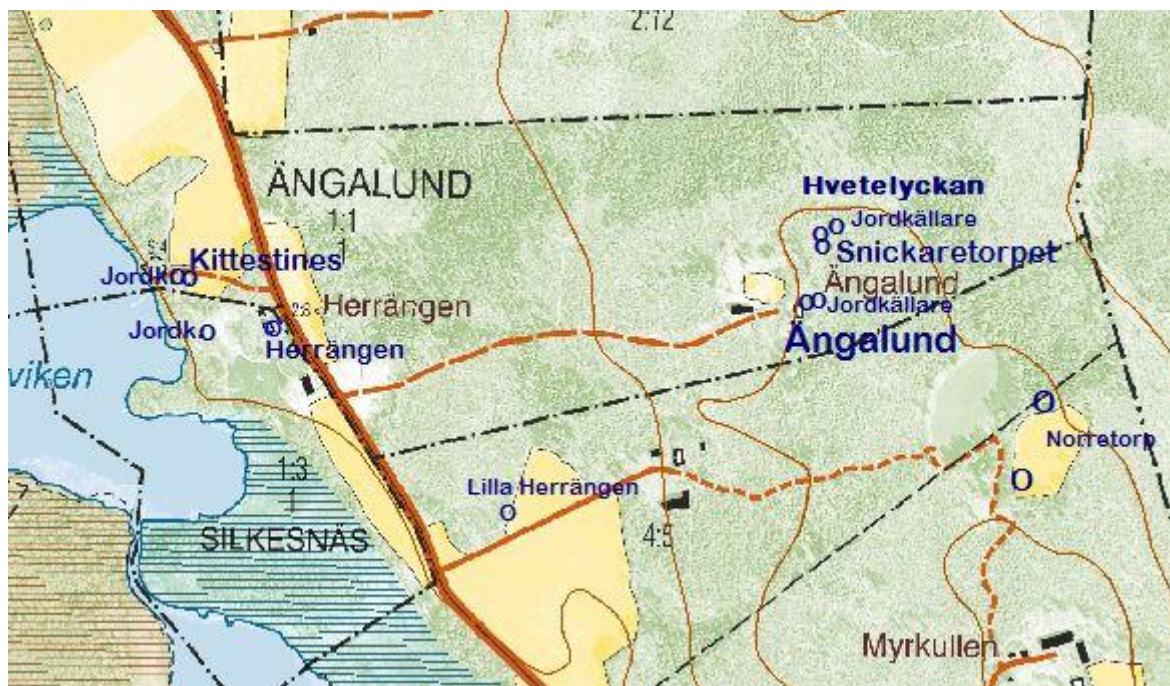
Utdrag från fastighetskartan © Lantmäteriet 452076

Läge koordinater (RT90 2, 5 gon W 0: -15):