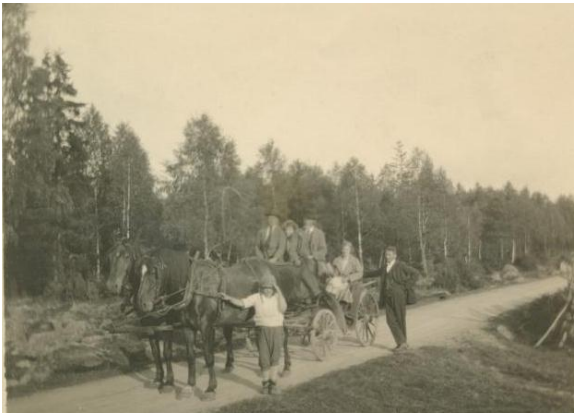
Resesällskap på häradsvägen. Personer okända