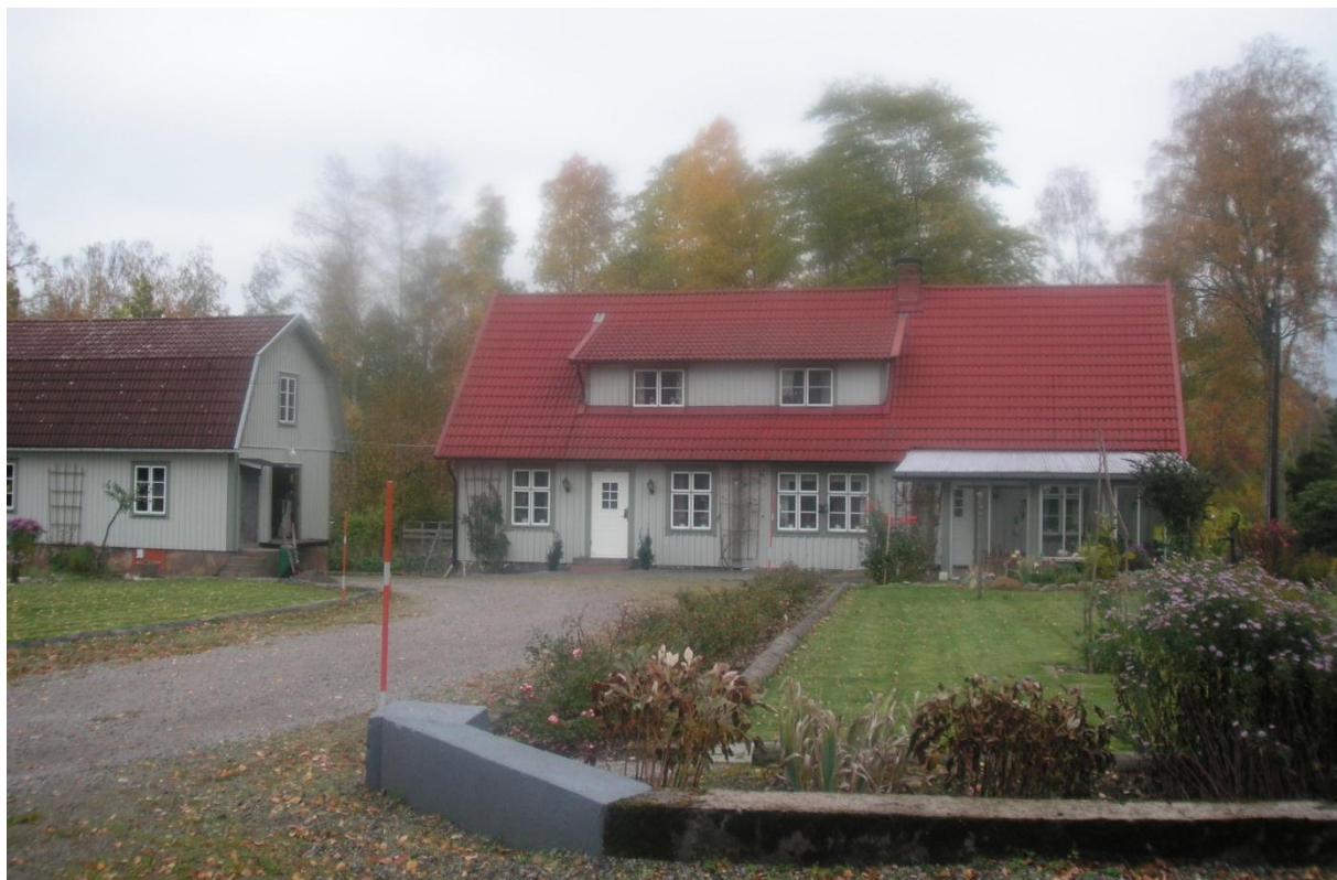
Hagstad Granelund.