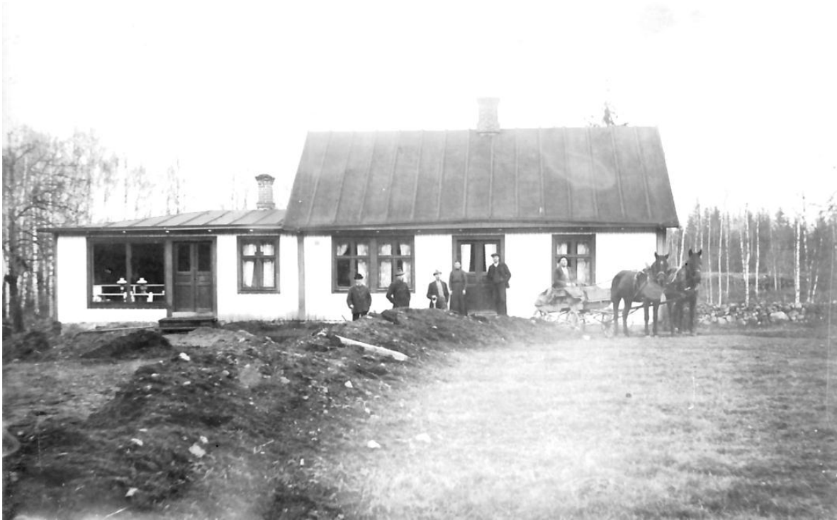
Granelund med tillbyggd affärslokal till vänster, Tilda Berg stående till vänster om entrédörren, Foto sannolikt från omkring 1930.