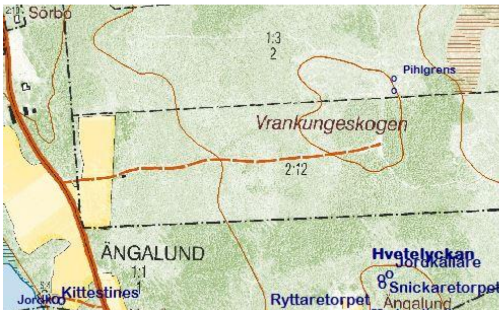
Utdrag från fastighetskartan © Lantmäteriet 452076

Läge koordinater (RT90 2, 5 gon W 0:-15): Latitud longitud (SWEREF 99 WGS84):