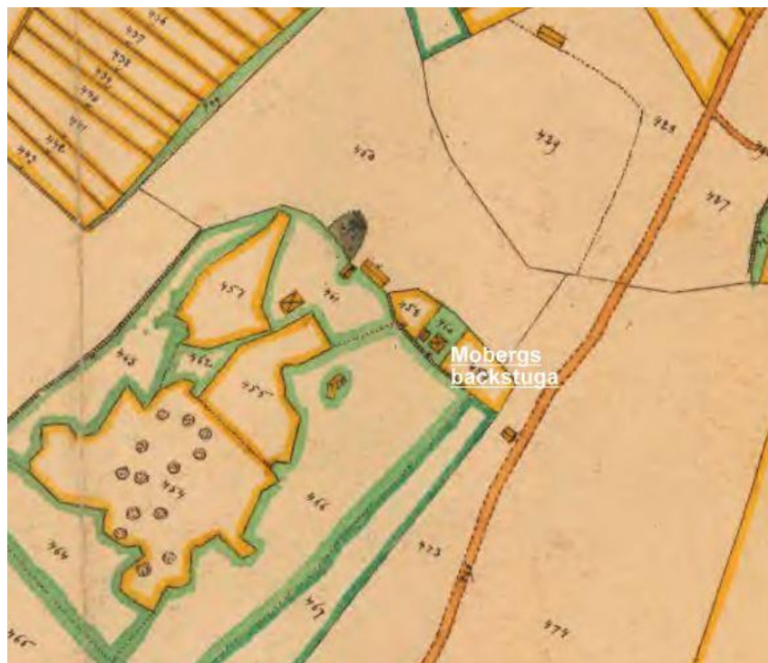
Utdrag från karta 1884 Lantmäteriet

Torpet fanns mellan åren 1720 till ca 1930. Mobergs backstuga fanns till slutet av 1900-talet.