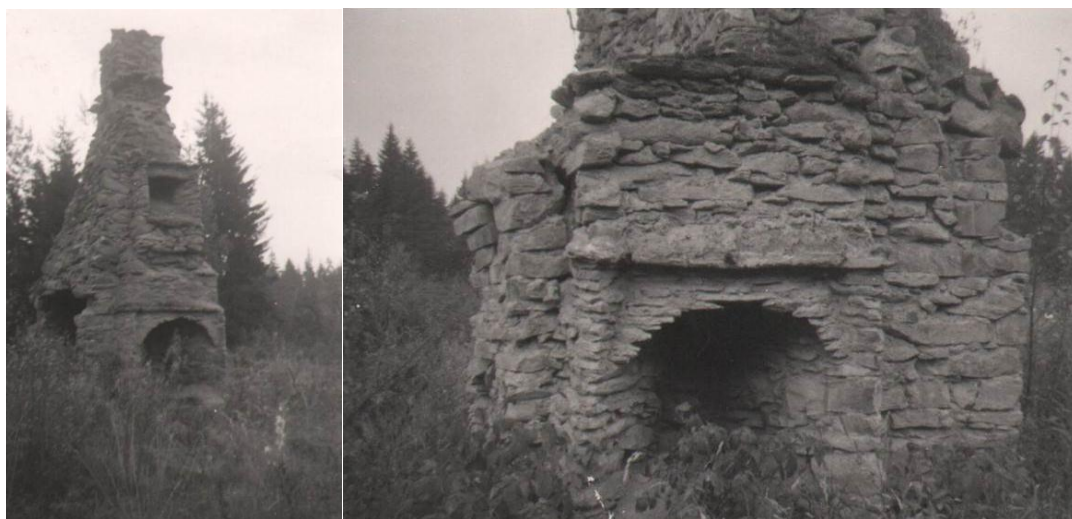
Husgrunden i Brevik.