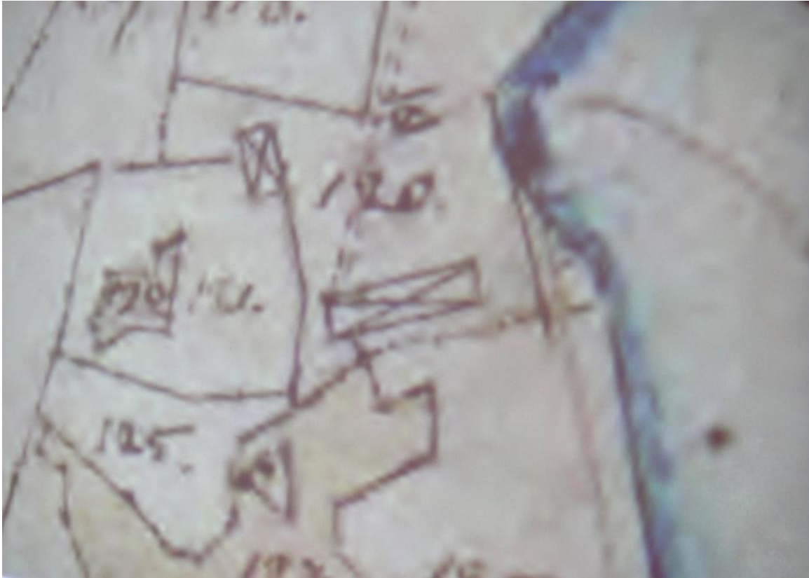
Del av karta från 1839 med torpet Bjurkärr, utvisande ryggåsstugan (Lantmäteriverket)

1821 brukades Bjurkärr av åboen Magnus Pehrsson. År 1837 fanns de två stugor i Bjurkärr. Den ena var en ryggåsstuga med tak av torv och näver. Den hade "stuga, förstuga, kök och framkammare i gott skick, 15 ¼ aln långt, 2 ¼ aln högt och 9 alnar brett, (dvs. 66,7 kvm i byggyta - 9,15 x 5,40 meter samt 1,35 meter hög - byggnaden bör ha sett ut som hembygdsstugan "Kurran" i Vrankunge, men något lägre för att spara på timringen). Det var i detta hus som "Petter i Bjurkärr" bodde.