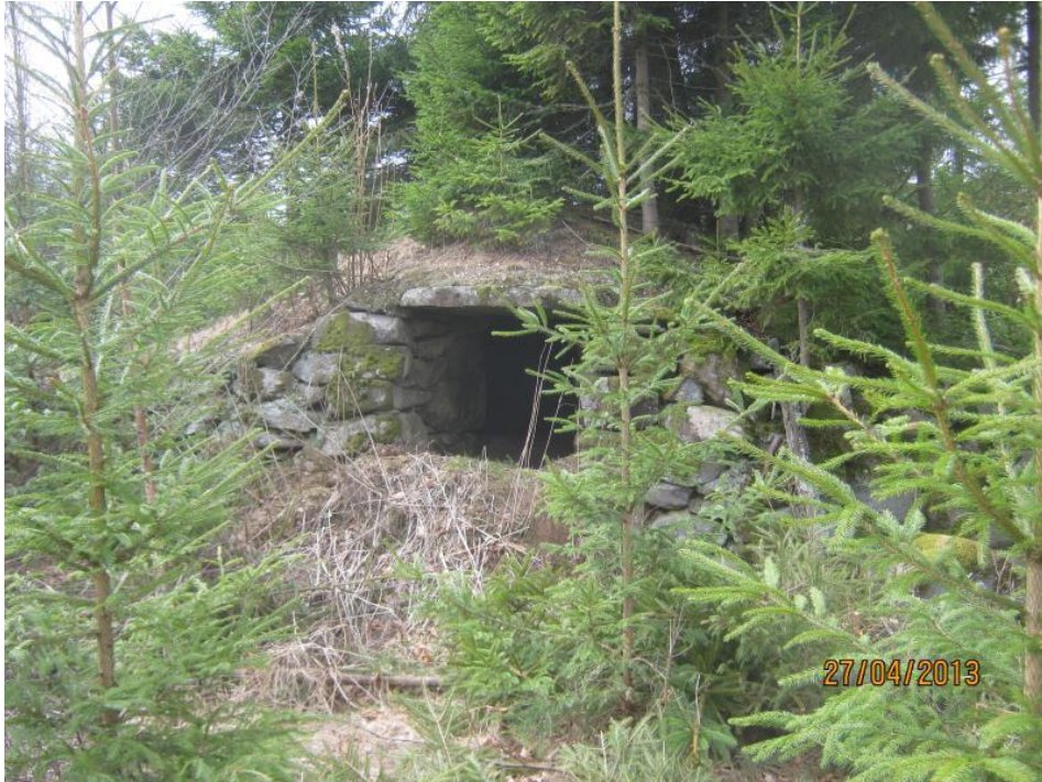
Bilden visar jordkällare som tillhör torpet.