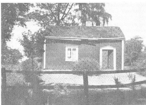
Foto från 1940. Berget.