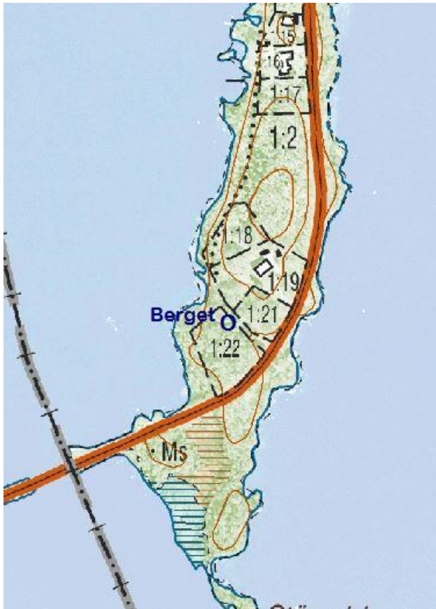
Utdrag från fastighetskartan © Lantmäteriet 452076

Latitud longitud (SWEREF 99 WGS84): N 56 41 37,5 E 14 36 48