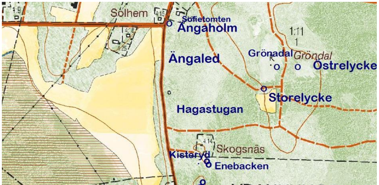
Utdrag från fastighetskartan © Lantmäteriet 452076