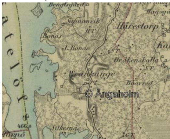
Utdrag från generalstabskarta 1869 Lantmäteriet

X= 6287355 Y= 1428545 N= 56 42 28 E= 14 38 19