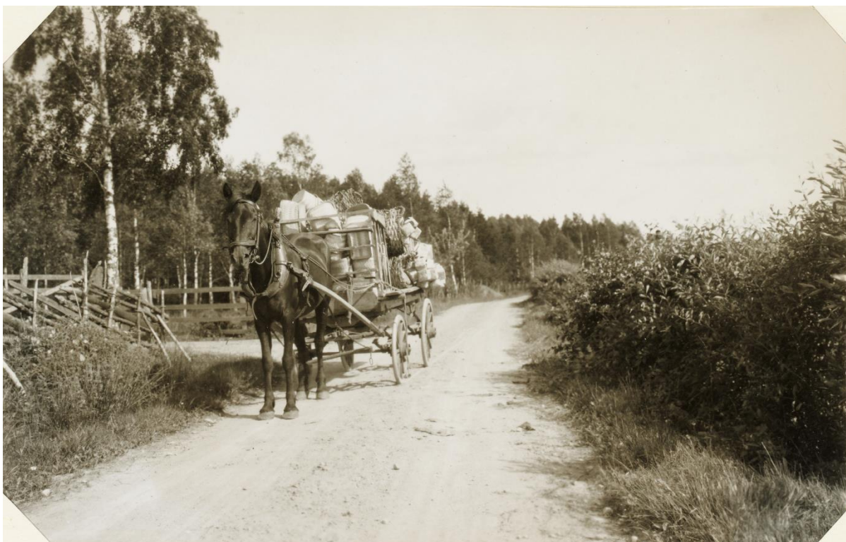
Häradsvägen mellan Vrankunge och Sirkön, sannolikt vid Myrkullen. Försäljare av krogarbeten. Foto från 1929, Lunds Universitetsbibliotek.

Skiftesarbete inleddes med en genomgång av befintligt kartmaterial, bland annat från storskiftet och kartor från angränsande områden. Efter fastställande av byns yttre och inre gränser vidtog arbetet med att gradera markområdena i olika klasser beroende på jordmån m.m. för att möjliggöra byten av olika skiften. Efter en överenskommelse om markbyten, för att samla markområden och flytta ut gårdar, följde värdering av byggnader och hur de olika jordägarna skulle kompensera varandra – särskilt de som behövde flytta sina hus. Utflyttning av hus och markarronderingen innebar också att en ny ”infrastruktur” behövde uppföras. Gårdar som miste sin tillgång till sjön Åsnen för vatten till sina kreatur fick rätt att leda dessa över grannens ägor. Nya vägar, stängsel och fägator uppfördes. Vid denna tid tillkom många nya stengårdsgårdar. Noggranna protokoll fördes. Av dessa framgår att en viss oenighet givetvis fanns mellan gårdsägarna som slutligen avgjordes genom förrättningsmännen. Protokollen omfattar 110 sidor med mycket detaljerade uppgifter om skiften av jordlotter och flytt av byggnader, gårdsgårdar och vägar m.m. samt kartor.