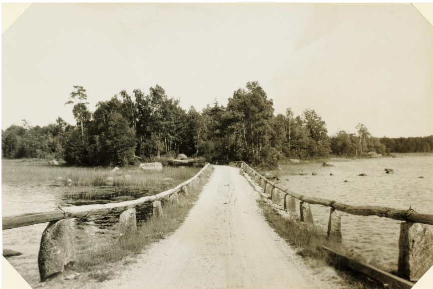
Norra Sirköbron sedd från Hössösidan , bilden ovan från 194 och nedan 19292, Lunds Universitetsbibliotek.

Brobyggnationerna var angelägna då vägarna var dåliga (undantaget vintervägar över isarna). Huvudvägen från Växjö till Skåne gick över gästgiverierna i Nöbble, Gottåsa och Diö och till Blekinge över Ingelstad, Uråsa och Kvarnamåla. Däremellan, i Åsnenområdet, var det usla kommunikationer. Vägsträckan Huseby, Vaghult, Kalvsvik till Jät, med gästgiveriet i Kråketorp underlättade postgången och transporter när denna etablerades. Bönderna i Skäggalösa by fick på 1830-talet tillstånd av Kommerskollegium att bedriva kreatursmarknad i Vaghult ("Hultamarken") vår och höst. De uppförde och ägde marknadsstånd, varav en del finns kvar än idag. Efter marknadsdagen samlades bönderna i Skäggalösa by hos åldermannen för att dela på avgifterna från marknadsstånd och försäljningsplatser.